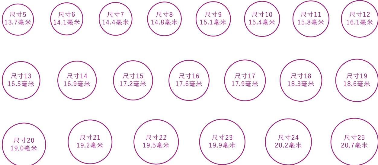
測量戒指指環尺寸一般用於亞洲國家